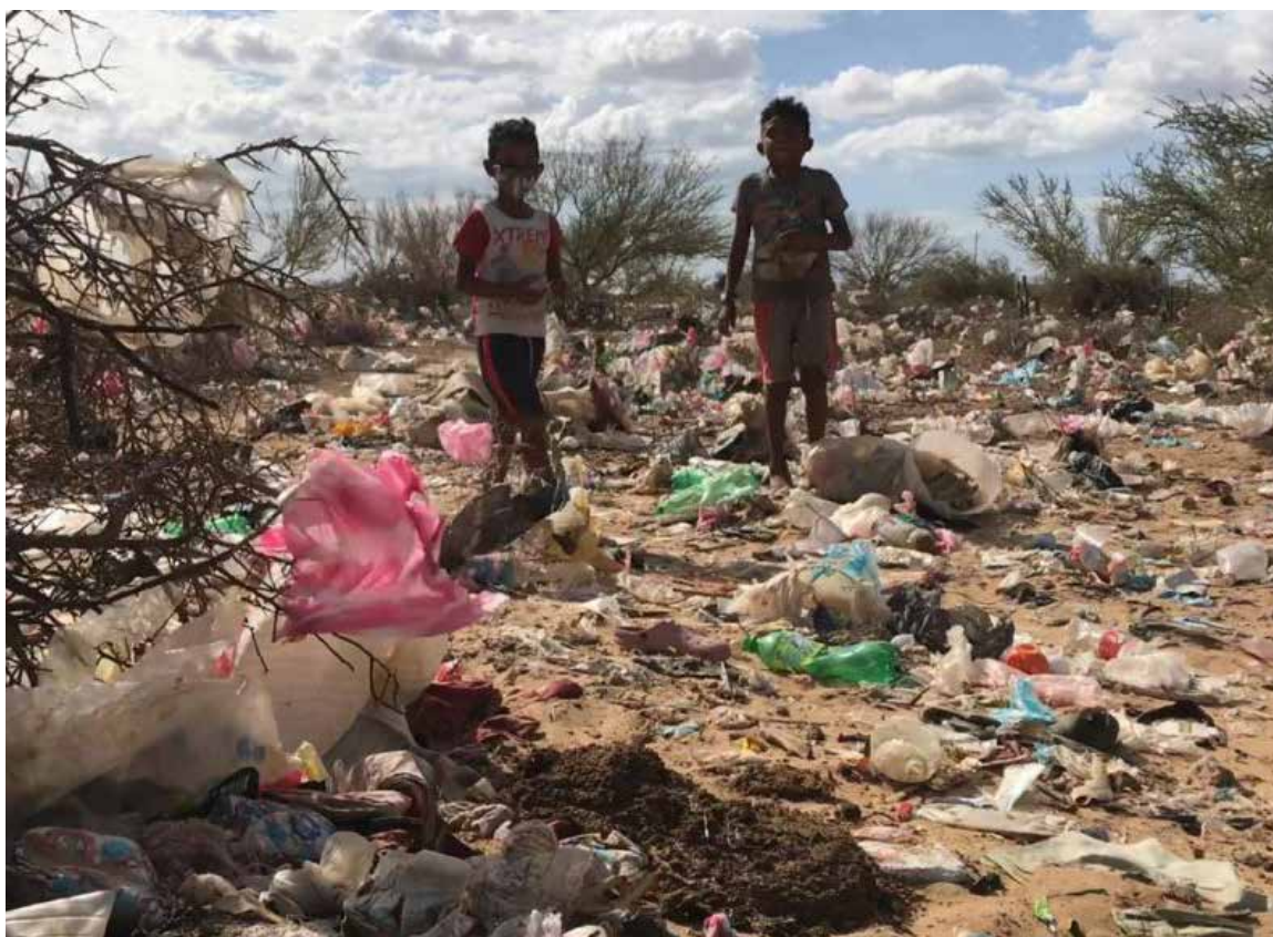
Mientras la corrupción acaba con Colombia, niños en La Guajira buscan alimentos en los basureros.

El Informe Global sobre Crisis Alimentarias 2024 publicado por la Organización de las Naciones Unidas para la Alimentación y la Agricultura (FAO) y el Programa Mundial de Alimentos (PMA), revela que este nivel récord incluye a 570.000 personas en Etiopía, el sur de Madagascar, Sudán del Sur y Yemen que se encuentran en la fase de catástrofe y han requerido una acción urgente para evitar un colapso