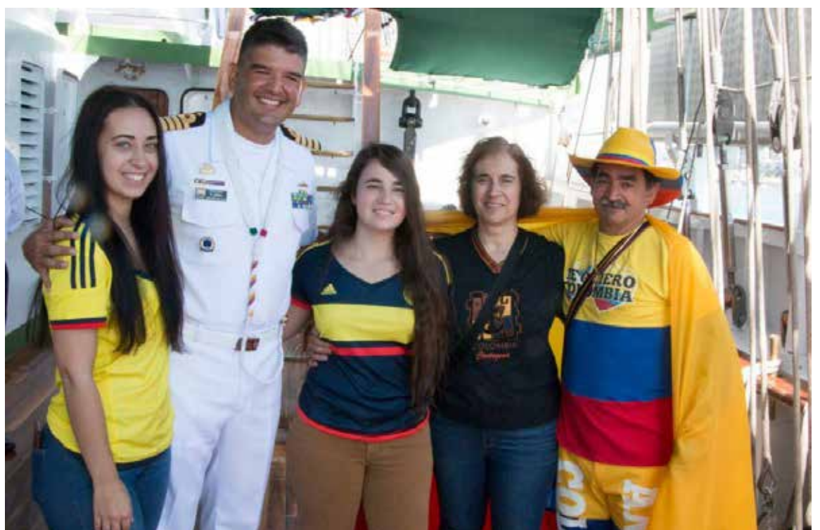
Los oficiales de la Marina saben quien es «Mister Colombia»

—Cuando pase esta pandemia, asistiré a todos los eventos colombianos que haya, espero que sea pronto. Oiga, ¿le gusta mi nueva pinta?