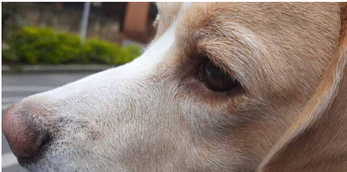
Las mascotas, perros, gatos y demás hermanos, son mucho más que un objeto comercial para los almacenes que se enriquecen gracias a estos animalitos, o algunos veterinarios que los utilizan para ganar dinero adicional recetando medicamentos.

Aunque está bajando la propensión a su abandono, en España ha sido tradición que llegado el verano, que comenzó el pasado 21 de junio, perros y gatos vayan a la calle, pues sus «amos» prefieren la playa. En