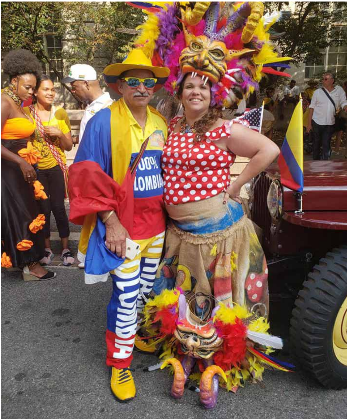
Todo un personaje, todos quieren tomarse una foto con «Mister Colombia»

Santa Rosa de Osos. Allá donde el café, el plátano, mil frutas se producen en su tierra, donde decenas de aves recorren sus espacios aéreos y donde están las mujeres más lindas y trabajadoras de nuestro país. ¿Cuándo vamos?