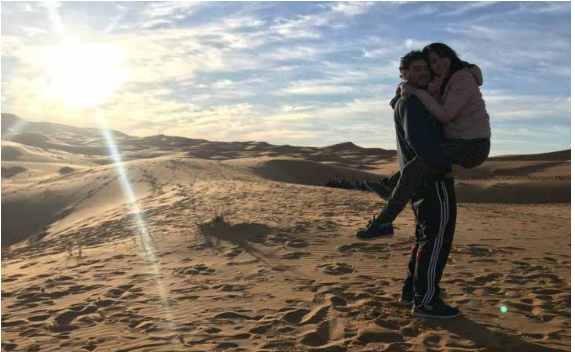
Las parejas acuden al desierto de Villa de Leyva.