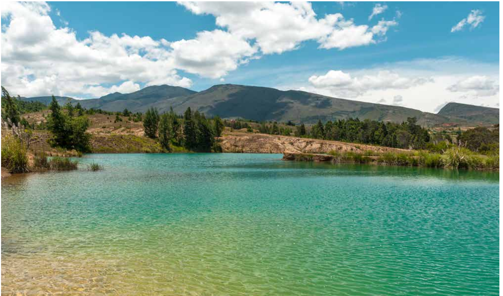
Único desierto en el mundo rodeado de pozos de agua.