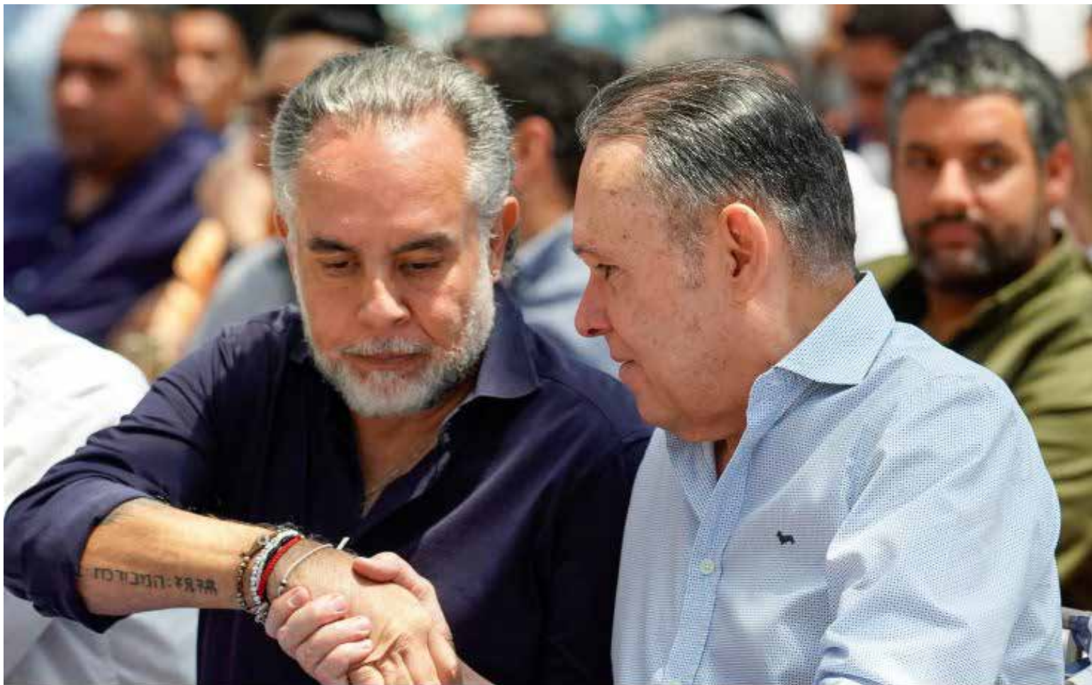
En un giro inesperado, el ministro del Interior, Armando Benedetti, y el presidente del Congreso, Efraín Cepeda, parecen estar dándose una nueva oportunidad para reconstruir su relación, previamente marcada por fuertes tensiones. Este acercamiento se produce en medio de un ambiente político polarizado.

El ministro Benedetti no dudó en recordar episodios anteriores que, según el Gobierno, evidencian un patrón de bloqueo. Mencionó la «votación inédita» en la Comisión Séptima, donde senadores no ponentes firmaron una ponencia negativa, y la fallida Consulta Popular. «Bas-